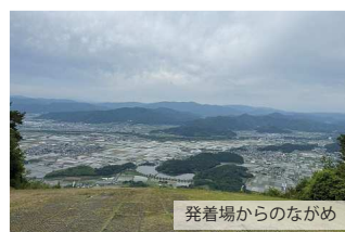
発着場からのながめ