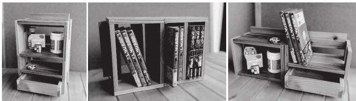
(A) 上下連結しました (B) 上下連結して横倒しにしました (C) 左右連結しました