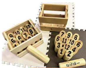
ヒノキモルックセット