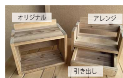
●机の連結整理木箱 各880円 (オリジナル・アレンジ) ●机の連結整理木箱用(引き出し) 600円