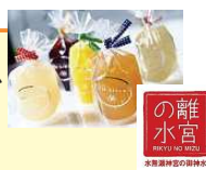
の離水宮 森の森神社の御神水

時間 : 9:00~12:00 集合場所 : 椎尾神社 雨天 : 小雨決行、荒天中止 対象 : 小学生中学年以上(小学生は大人とご一緒に) 参加費(税込) : 600円/人 定員 : 20組 申込期限 : 令和7年10月2日(木)