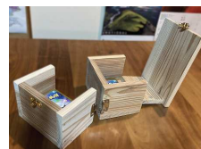
●カードボックス 1,430円 (2マス連結型)