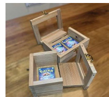
●カードボックス 各1,320円 (縦深型・平置型)