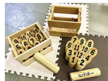
●ヒノキモルックセット 4,500円