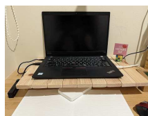
●ヒノキパソコン台 3,850円